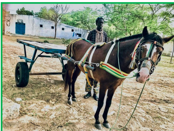
Achat d'une charrette et d'un cheval pour transporter le pain dans les villages