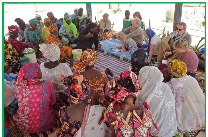
Réunion préparatoire au projet. Les femmes sont venues de plusieurs villages à la ronde