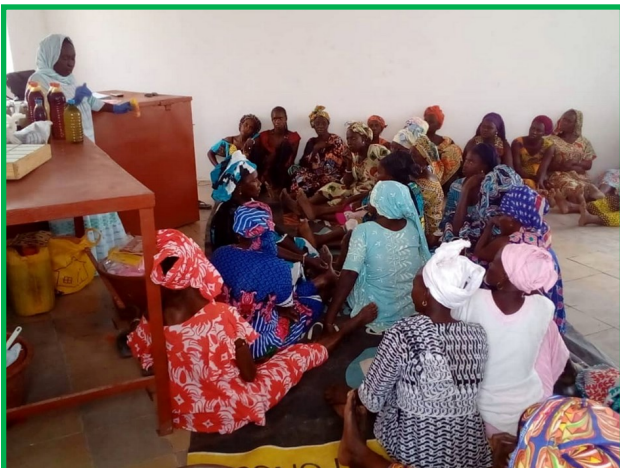
Atelier de fabrication de savons

95 femmes (et quelques hommes ) de Darou Ndimb et des villages avoisinants , organisées en GIE, ont été formées et produisent à présent de la vannerie, de la poterie, des savons, du pain vendu dans les villages. Elles ont et vont aussi cultiver du manioc, des arbres fruitiers et du maraîchage dans l'espace agroforestier. Tout cela leur procurant des revenus et une meilleure alimentation.