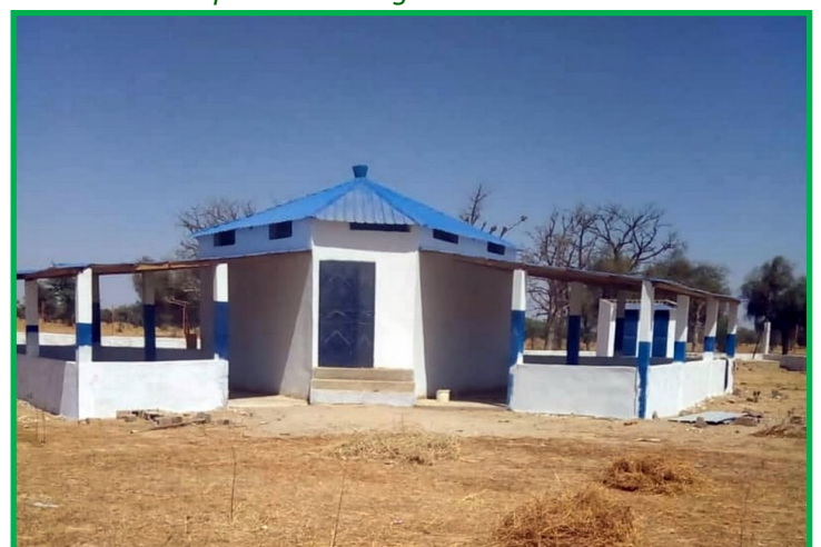
Bâtiment pour accueillir les ateliers