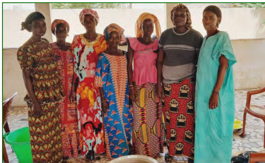
Equipe nombreuse à l'école élémentaire