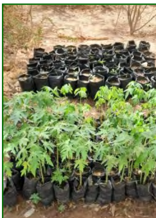
Préparation de pépinières au jardin faune flore.

Les champs de Keur Potié et du jardin faune flore continuent avec quelques aléas dus à des coupures d'eau, la très grosse chaleur avant l'hivernage (saison des pluies à partir de juillet) et la difficulté d'une agriculture biologique. Mais les femmes continuent à s'investir et à fournir de gros efforts.