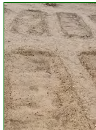
Préparation de planches à keur Potié pour des plantations de piment et gombo.