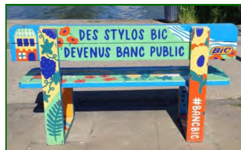
Joli banc grâce aux stylos usagés. Photo prise à Auxerre en juin