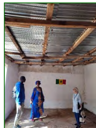
Salle de la grande section

En raison du gros projet Eau et Assainissement, nous avons réussi depuis deux ans à anticiper et à récolter les 23713€ grâce à vos adhésions et vos dons pour couvrir les dépenses supportées par SNF uniquement.