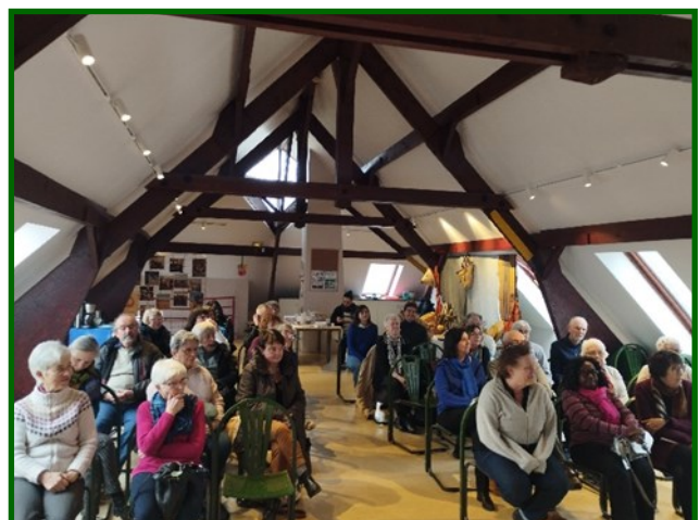
Une assemblée attentive