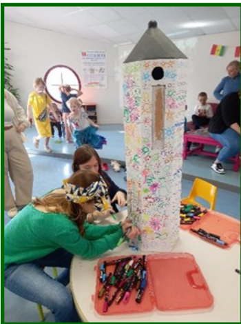
Le crayon géant décoré par les enfants