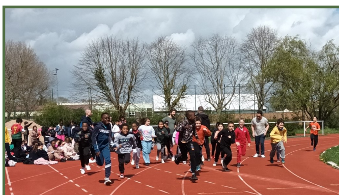
Directeur (en noir), enfants, parents et enseignants le jour de la course solidaire